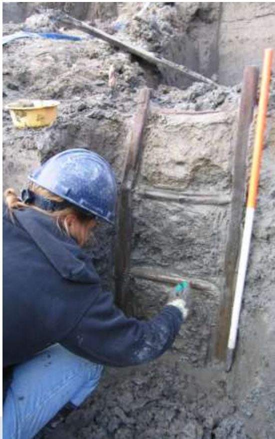
Foto: Hoewel hout in het veld zichtbaar is, zoals de hier gefotografeerde Romeinse ladder van ten minste 110 cm lengte, is een microscoop nodig om te achterhalen uit welke houtsoorten deze bestaat.

Als het specialistisch onderzoek plaats vindt in het kader van een groter archeologisch onderzoek, dan koppelt de opdrachtnemer de resultaten van het specialistisch onderzoek aan het archeologisch rapport.