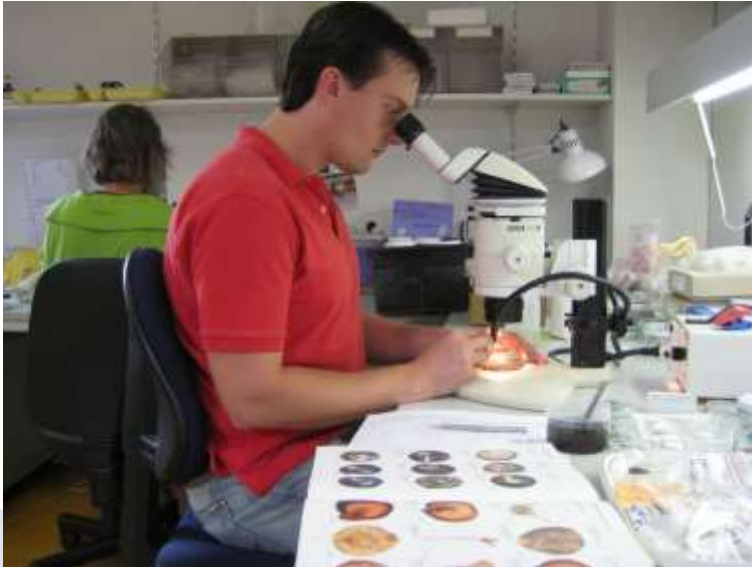
Foto: Opvallend-lichtmicroscop met vergroting tot 50x, een lichtbron met koud licht en flexibele lichtpunten, voor analyse van botanische macroresten.

Als op basis van het onderzoek de conclusie kan worden getrokken dat er behoudenswaardige archeologische vondsten aanwezig zijn in de bodem van het desbetreffende terrein, kan het de gemeente aan de vergunning het voorschrift verbinden dat opgravingen moeten worden uitgevoerd. Aan de vergunning kan ook het voorschrift worden verbonden dat ter behoud van de archeologische vondsten in situ technische maatregelen moeten worden getroffen. Tot slot kan het bevoegd gezag Wabo aan de vergunning een voorschrift verbinden ten aanzien van de vereiste archeologische maatregelen.